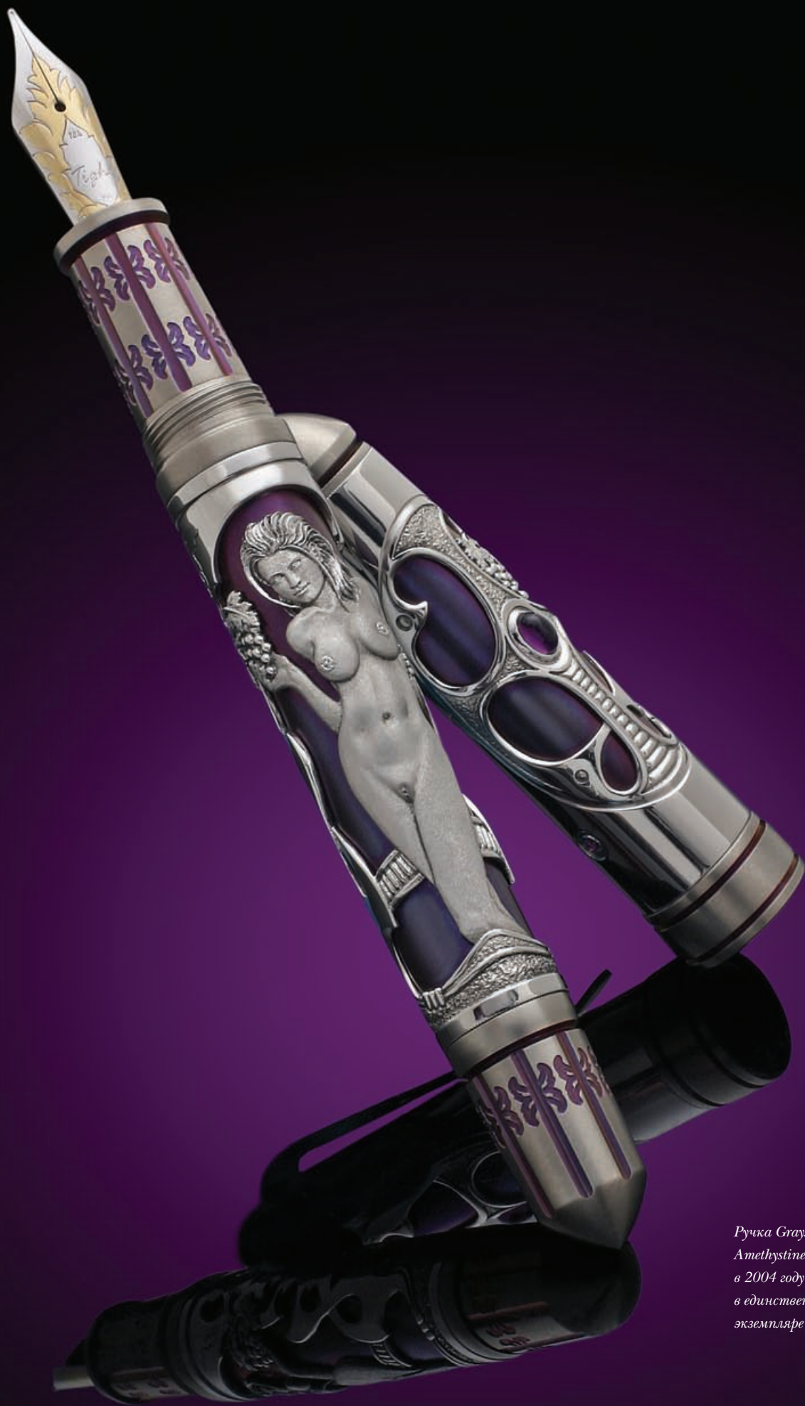
Ручка Grayson Tighe Amethystine выпущена в 2004 году в единственном экземпляре