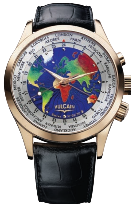
Часы из коллекций At the Races и The World