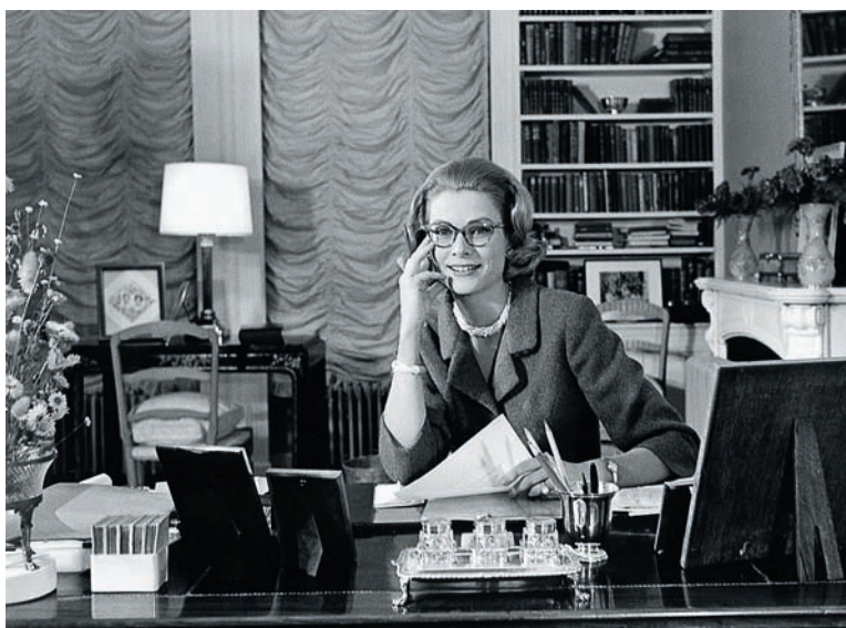
Фото: 1960 © Archives du Palais Princier-Monaco Copie.

А у организаторов выставки хватило таланта сделать, казалось бы, невозможное — создать идеальный, благородный, но совсем не скучный и не сказочный образ принцессы XX века, пренебрегая мелодраматизмом и пошлостями, то есть не используя главных козырей больших голливудских филь-