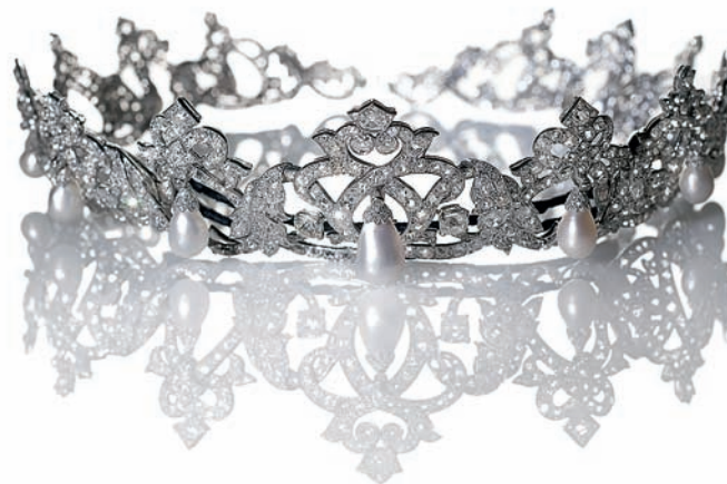
Диадема от Картье из коллекции матери Ренье, княгини Шарлотты, которую Грейс Келли надевала на «Бал столетия» в 1966 году

Среди них есть несколько записок Альфреда Хичкока – именно три его фильма сохранили на века актрису Грейс Келли. Хичкок нашел в ней свою идеальную блондинку – абсолютную красавицу, решительную и бесстрашную. Она уверяла, что обязана ему всеми своими знаниями о кино. «Это именно то, что я искал уже давно. Она обольстительна без сексуальности. Это вулкан под снегом. За ее холодной, подчеркнуто respectable внешностью скрывается невообразимый жар страстей, который способен сотворить чудо на экране» – это слова режиссера об актрисе. Но Грейс Келли удалось сотворить чудо не только на экране: она стала настоящей принцессой. Этого не сделала ни одна актриса.